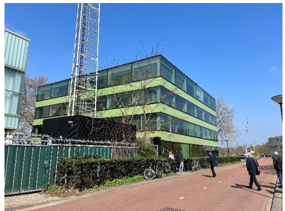
Billede af det forsorgshjem for hjemløse, som udvalget besøgte

I Amsterdam har man i arbejdet med de hjemløse fokus på en lang række parametre, såsom gæld, bolig og misbrug. Det er således erfaringen, at man er nødt til at arbejde med disse parametre for at sikre en bedre tilværelse og for at få folk ud af hjemløshed. Manglen på boliger er en stor udfordring i Amsterdam og gør, at man ikke har mulighed for at betale de høje huslejer. Man afsøger derfor også for private udlejere, som eks. vil leje et værelse ud. I den sammenhæng er der ofte tale om kortere lejekontrakter, hvilken ikke skaber den nødvendige kontinuitet for dem, som ønsker at komme ud af hjemløshed.