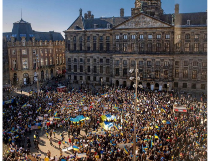
Billede fra Amsterdam, hvor der protesteres til fordel for Ukraine i forbindelse med Ruslands invasion.

I forlængelse af beskæftigelsesindsatsen til ukrainere, er man på nationalt niveau ved at se nærmere på om nogle af erfaringerne fra modtagelsen af ukrainere kan overføres til andre grupper. Eksempelvis er det en diskussion pt. om det er hensigtsmæssigt for mulighederne for beskæftigelse at være placeret i modtagercentre i længere tid, hvor afstanden til arbejdsmarkedet typisk øges.