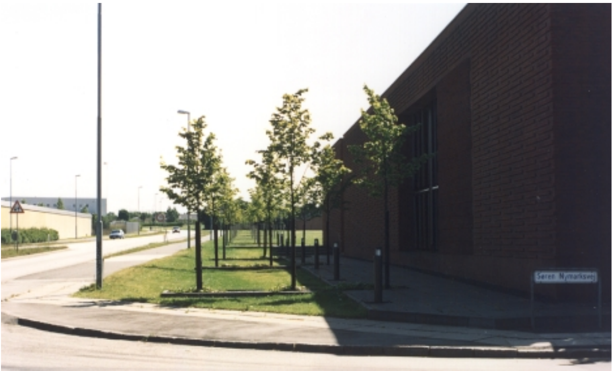
På erhvervsgrunden, der har en meget lang facade mod vejen, er der plantet træer i grupper på 3 og med god indbyrdes afstand. Flot beplantning. (Aarhus Stiftsbogtrykkerie, Ringvej Syd, Holme)