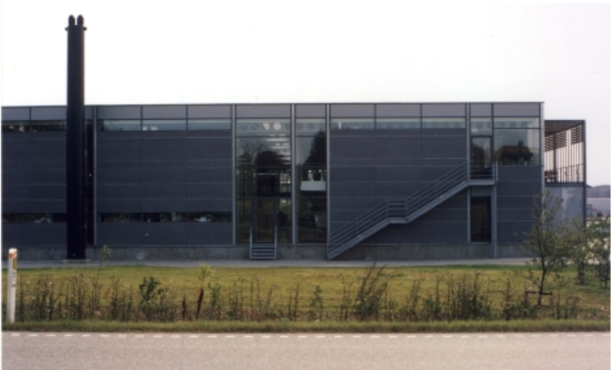
Produktionserhverv vil også fremstå synlige - med arkitektur af høj kvalitet. Mod vejen er der anlagt grøn zone med beplantning efter samlet plan. (Berendsen, Viborgvej, Tilst)