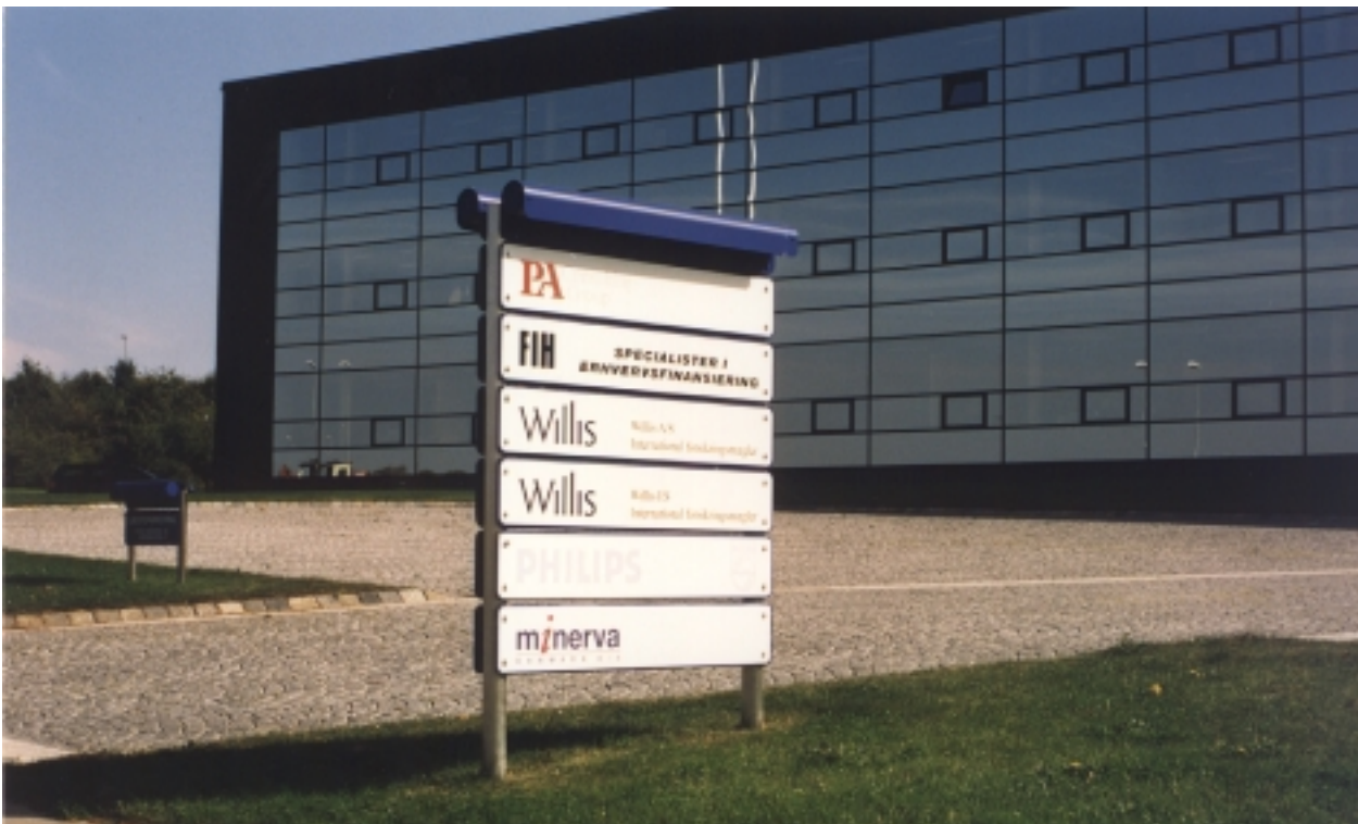
Når der er flere virksomheder i et erhvervshus, kan firmanavne og -logoer med fordel samles på ét skilt, placeret ved indkørslen. („Spejlbuen“, Brendstrupgårdsvej, Skejby)