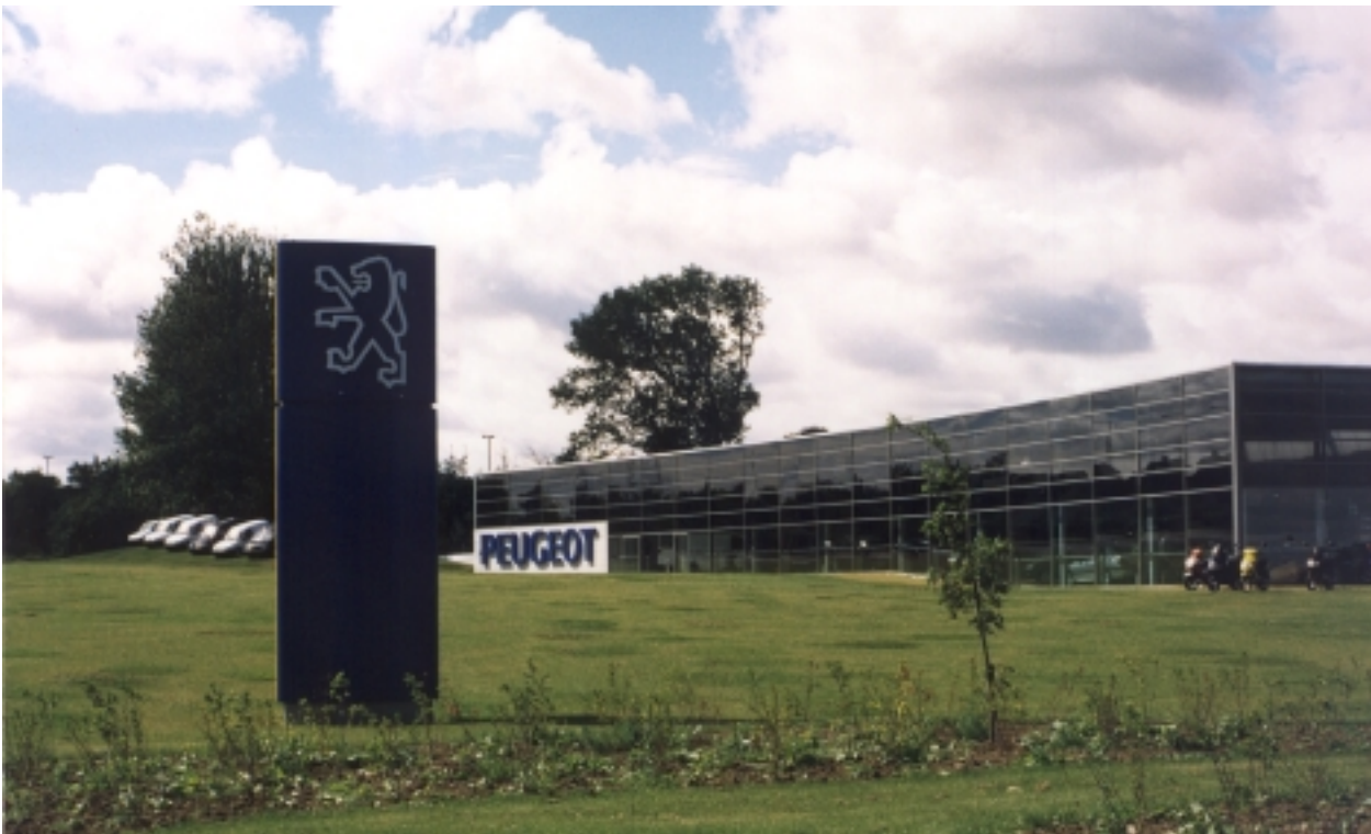
Skilt af pylon-type med god design. Med bomærke på pylon og firmanavn „indbygget“ i facaden har firmaet afleveret sit budskab enkelt og effektivt. (Peugeot, Hasselager Allé, Hasselager)