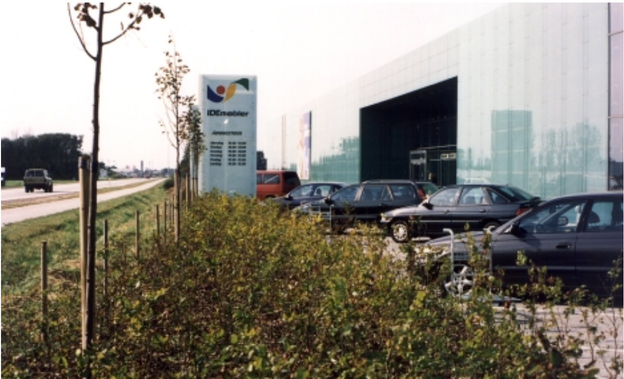
Virksomhed og parkeringsareal er meget tæt på vejen. Nyplantet bølgepur med opstammede lindetræer vil snart skabe en god løsning. (Idémøbler, Viborgvej, Tilst)