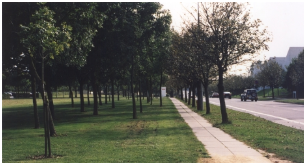
Trafikanter får oplevelse af at køre i en park. I vejens skillerabat er plantet allétræer. På grønne forarealer spredte træer og lunde. (Danmarks Radio, Gøteborg Allé, Christiansbjerg)

Der kan herudover ikke etableres bygninger, parkering, oplag, udstilling eller lignende.