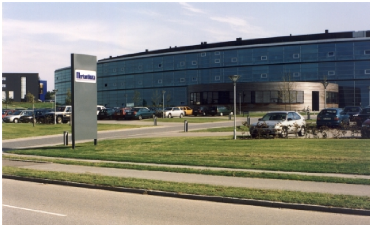
Stort parkeringsareal mellem vej og bebyggelse. Bredt grønt areal mod vej. Opdeling med grønne hække og beplantning, der om få år vil give en „grøn“ og smuk parkering. (Merkantidata, Brendstrupgårdsvej, Skejby)