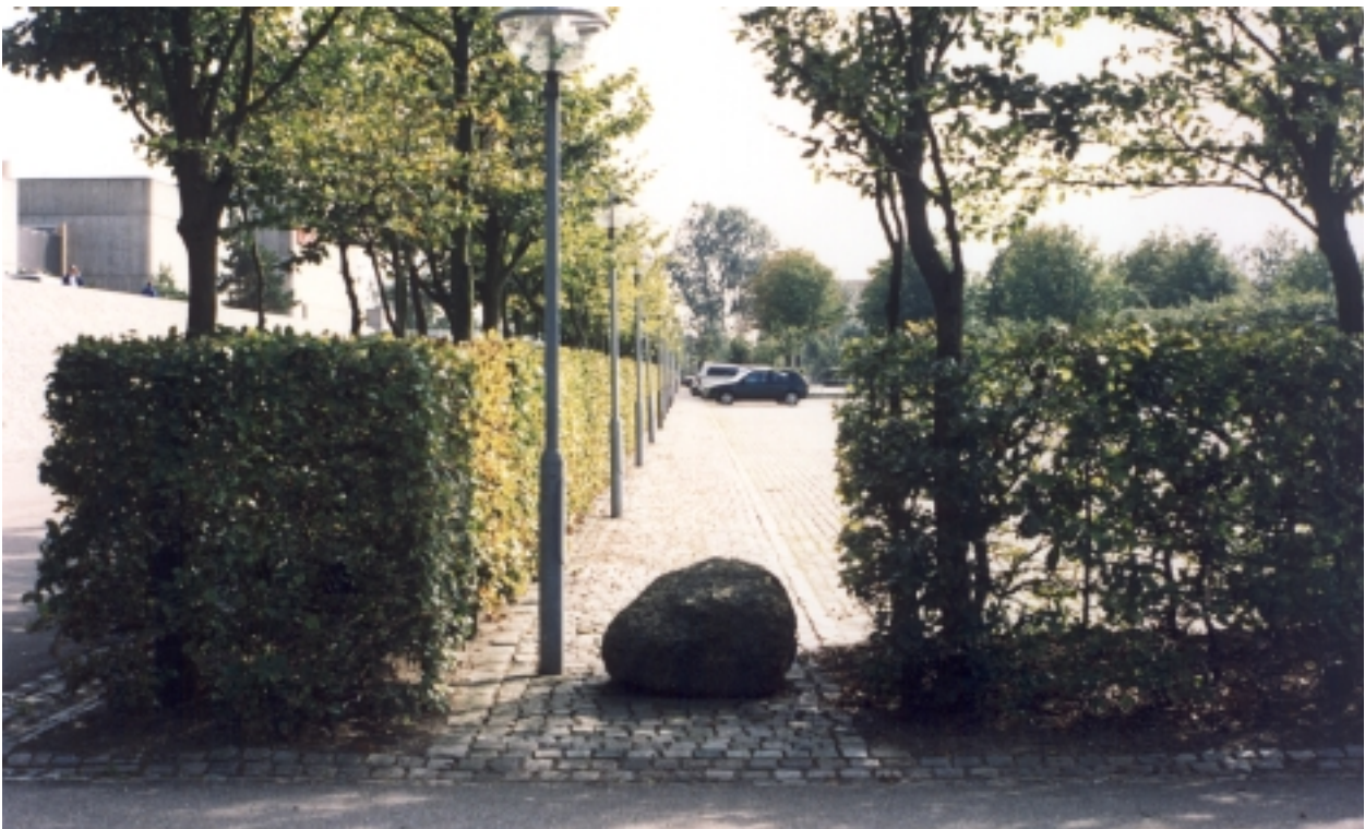
Meget smuk parkeringsplads med grønne rum. Bepantning, belægninger og parkbelysning er af høj kvalitet. (Danmarks Radio, Gøteborg Allé, Christiansbjerg)