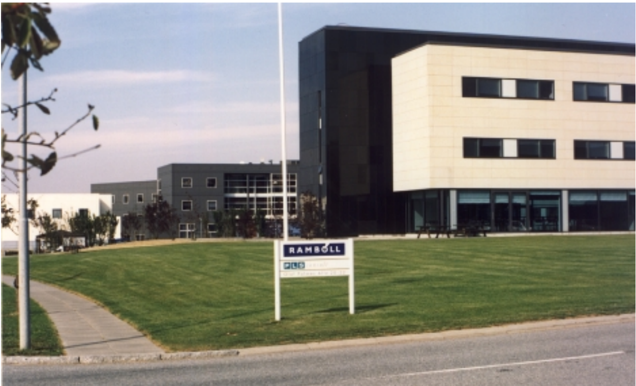
Erhvervsbebyggelse beliggende i parklignende omgivelser - uden synlige skel mellem virksomheder og mod vej. Alle facader fremstår med god arkitektonisk behandling. (Rambøll, Olof Palmes Allé, Skejby)