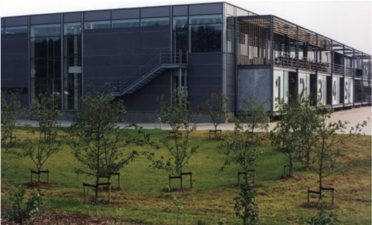
En trægruppe, indpasset i den grønne zone og efter samlet plan, giver bebyggelsen en grøn indramning. (Berendsen, Viborgvej, Tilst)