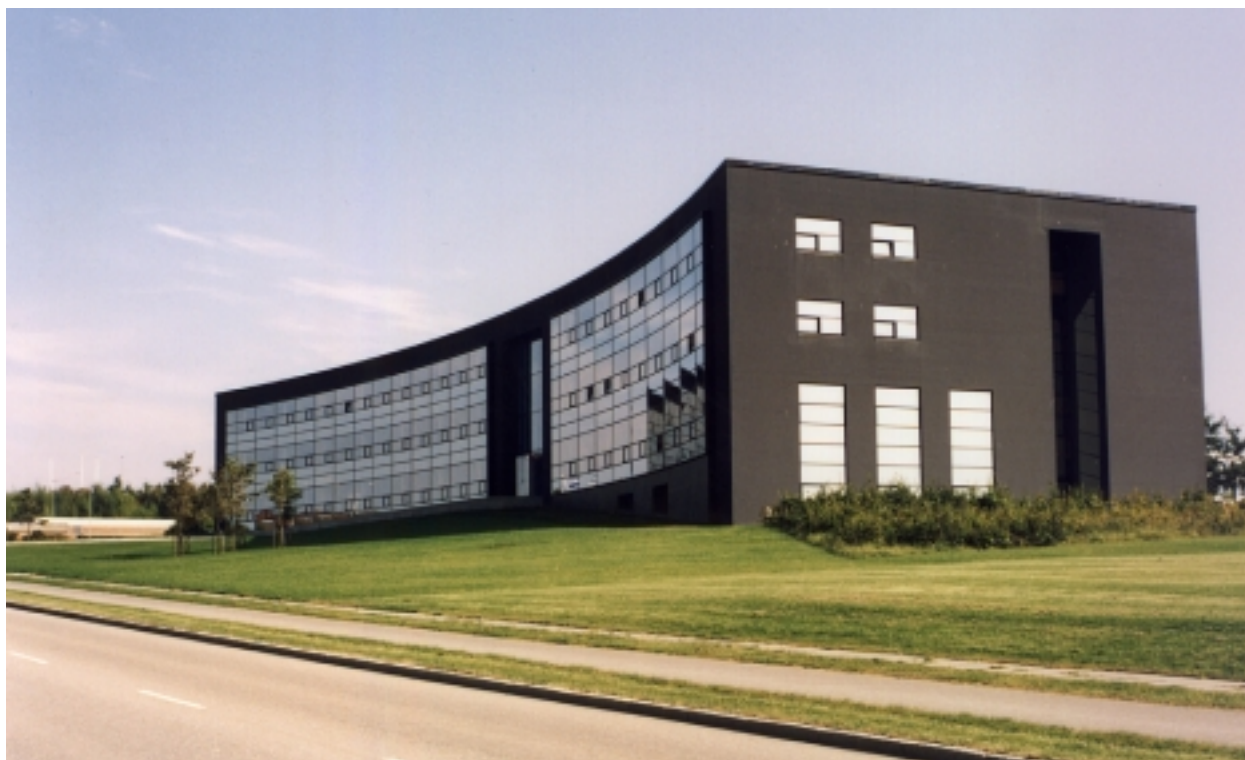
Bygning med en klar hovedform og farveholdning. God helhed mellem bebyggelse, terræn og omgivelser. Et erhvervsprojekt med høj arkitektonisk kvalitet. („Spejlbu“; Brendstrupgårdsvej, Skejby)