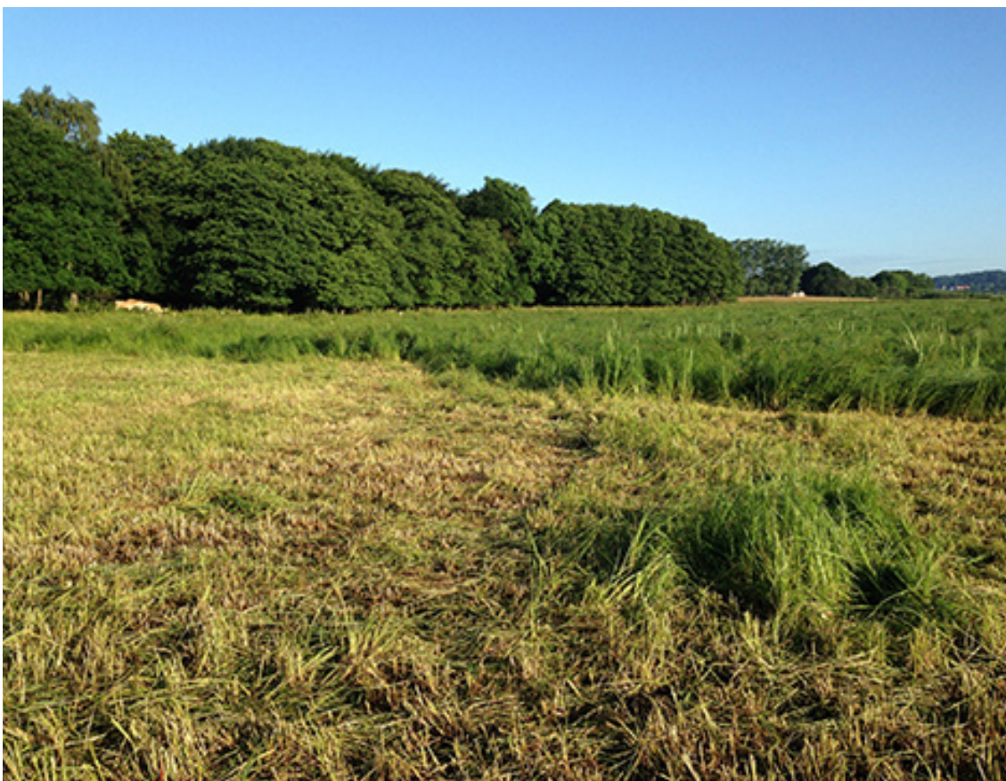
Juli 2016 – Høslæt, som supplerende indsats for at holde kærarealet lysåbent.

Det vurderes derfor, at der ikke er behov for en nærmere fordeling af indsatserne mellem handleplanmyndighed og offentlige lodsejere for de enkelte retningslinjer i Natura 2000-planens indsatsprogram.