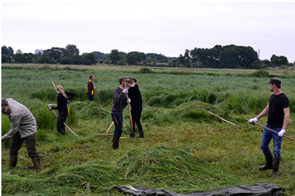
Juni 2016 – DN's studenter ungdom tager høslæt for at fastholde areal med rigkær.

Projekterne gennemføres ved frivillige aftaler, og derfor er det i mange tilfælde ikke på nuværende tidspunkt muligt at beskrive hvornår projekterne fysik bliver udført. Kommunen vil i hvert enkelt tilfælde sørge for, at relevante interessenter bliver inddraget.