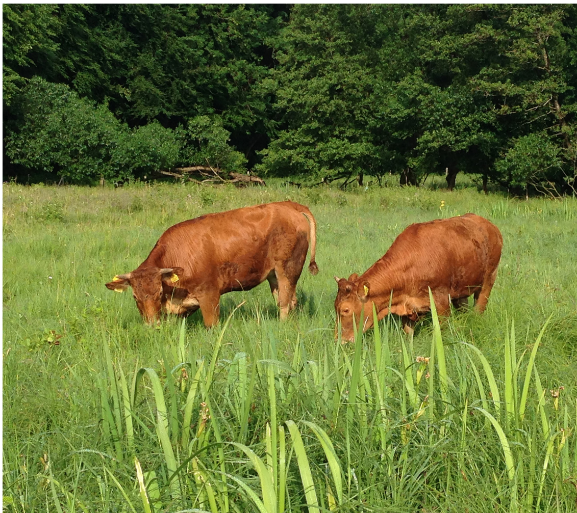
Juni 2016 – Græssende dyr på eng, som indeholder rigkær ved Brabrand Sø