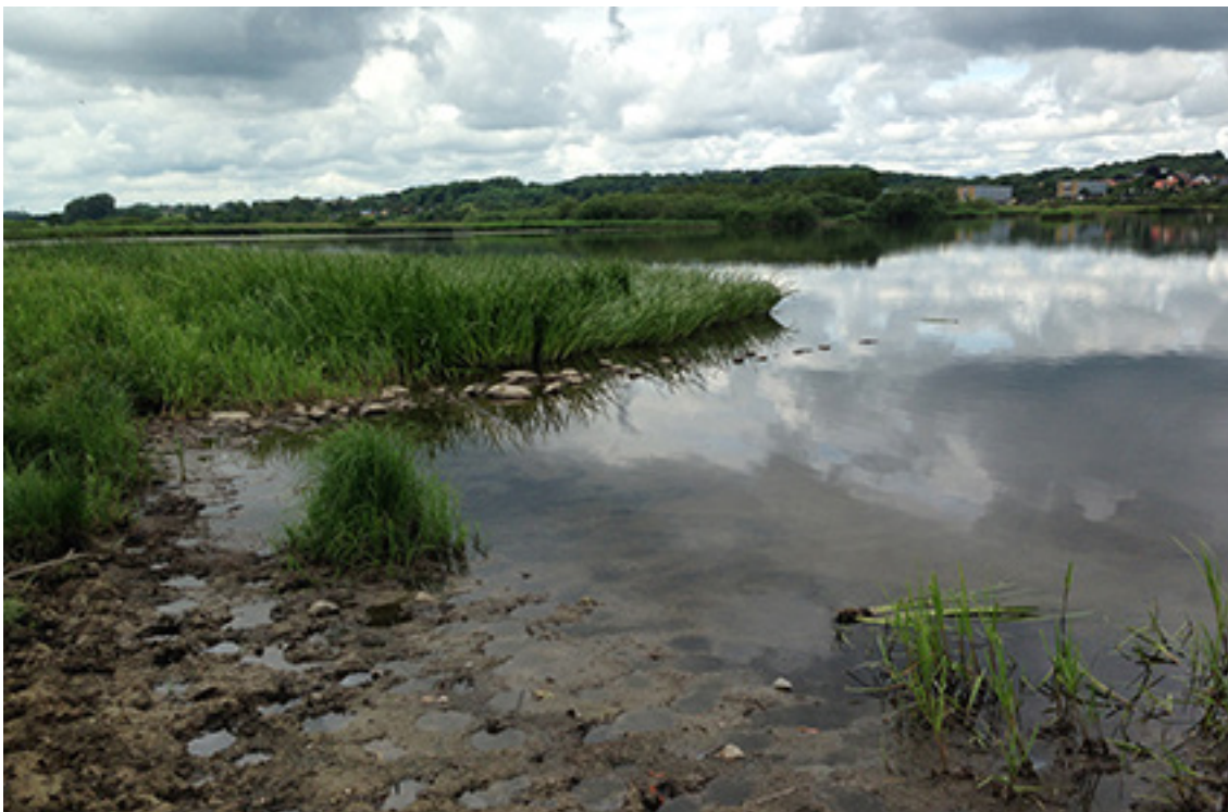
Sommer 2016 – Brabrand sø med bredvegetation. Her drikkested for engens græssende dyr.