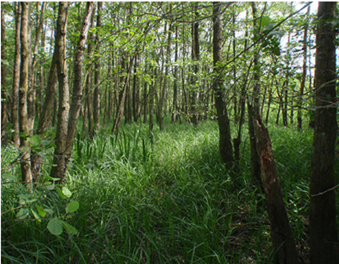
Yngre sumpskov ved Brabrand Sø.

Natura 2000-handleplanen for 2010-2015 kan ses på kommunens hjemmeside .